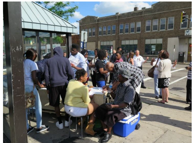
Qhov kev mus tham nrog cov zej zog hu ua Innovative community engagement no yeej pib thaum lub Rau hli ntuj hnuv tim 2-15 thiab yuav muaj mus kom dhau plaws lub Kaum Ob hli ntuj xyoo 2015. Qhov chaw tham nrog cov neeg no kuj mus xws li yog tom chaw npav nres ntawm tej qhov chaw, taj laj tshav puam, thiab lub koom txoos hu ua Open Streets Lowry, National Night Out (hauv qab no), thiab ntau qhov chaw.