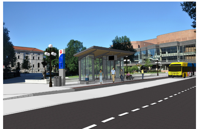
Estación Rice Park en el centro de St. Paul