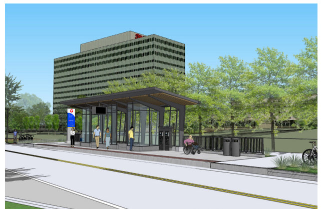
Estación de Maplewood