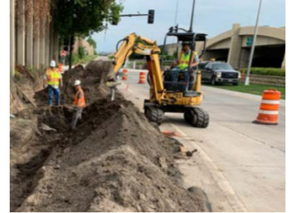
Ejemplo de cuadrillas colocando tubos de servicios públicos en la Línea Anaranjada