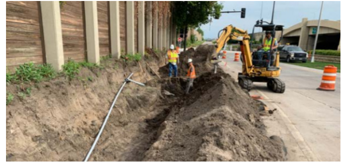
တၢ်အီၤတခါလၢပုၤမၤသကိးတၢ်ဖတိဖၣ် ဆီလီၤကျိၤဘိလၢကကဲဘျုးတဖၣ်လၢဘိဂီၢ်ကျိၤအလီၤ